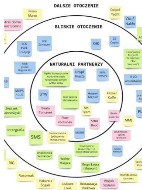
Zdjęcia: I warsztaty międzysektorowe, 21.09.2020 r.