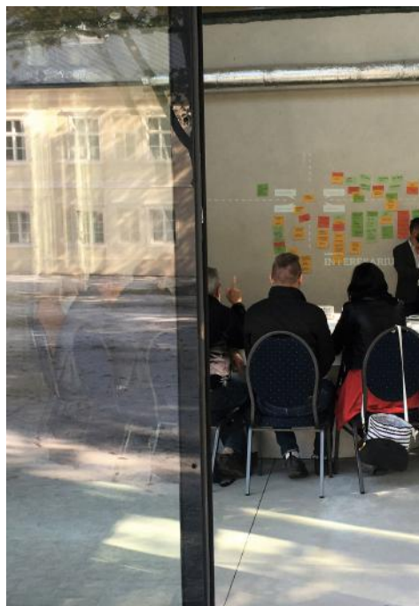
Zdjęcia: I warsztaty międzysektorowe, 21.09.2020 r.