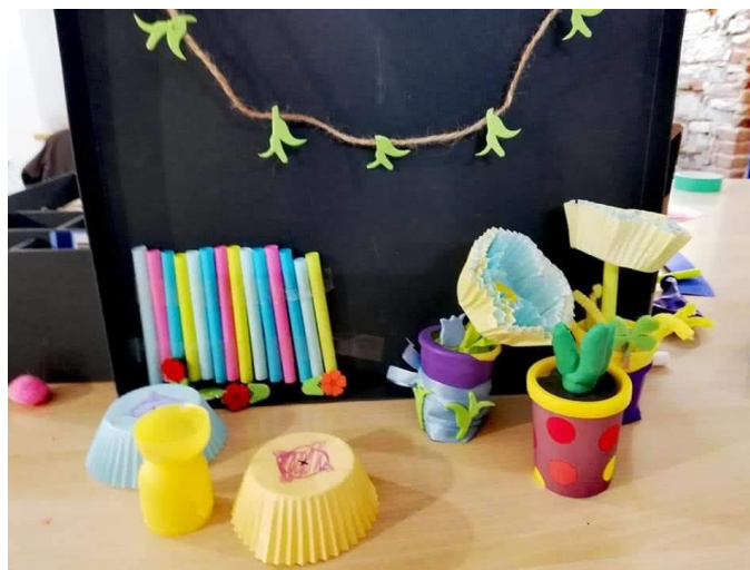
Materiały z warsztatów World Cafe z dnia 29 września 2021 r.

Wykonanie szybkich i łatwych prototypów pozwoliło uczestnikom zwizualizować własne pomysły. Kolejnym zadaniem było przetestowanie ich ze znajomymi za pomocą wideo rozmowy oraz z przypadkowo napotkanymi gośćmi w pałacowej restauracji. Wymiana doświadczeń z etapu testowania pozwoliła młodzieży dostrzec obszary, które wymagają dopracowania.