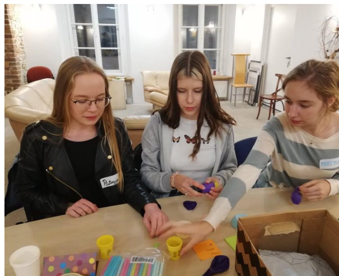
Zdjęcia z warsztatów na terenie Pałacu