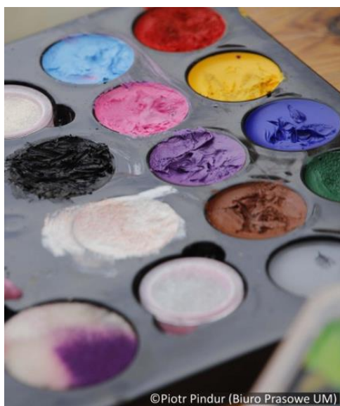
Zdjęcia z warsztatów i wydarzeń na terenie Pałacu