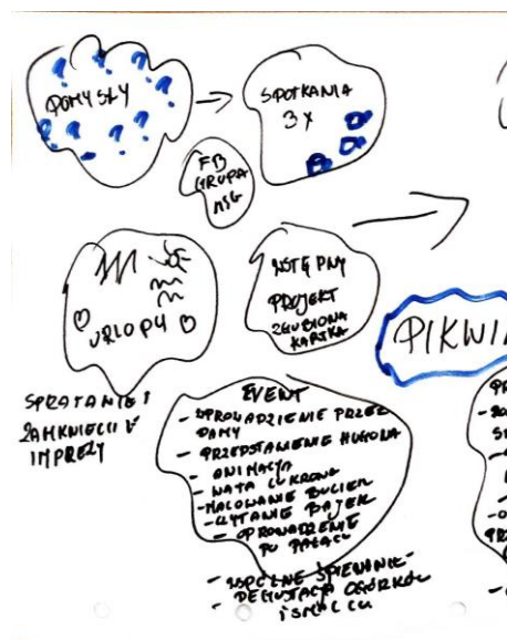
Materiały z warsztatów ewaluacyjnych z 19 października 2021 r.

Uczestnicy opracowali kalendarz wydarzeń na 2022 r. Przy czym zdecydowali, że jeszcze w grudniu 2021 r. podejmą się organizacji Biesiady Świątecznej. W kolejnym roku zaplanowane zostały: Familijny Szpil, Piknik Pałacowy z potańcówką, Bieg Piwna miła z biesiadą.